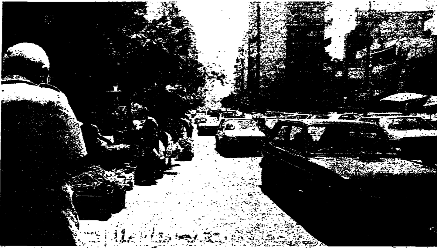
باعة وسيارات في عين الرمانة

الوضع الأمني في المنطقة الشرقية حافظ على هيبته لليوم الثالث على التوالي في ظل وقف النار المعلن في وقت استمر اقبال المعابر وتحدثت وسائل اعلام القوات اللبنانية، عن فتح معبر البويك لبعض الوقت. وقد أدى هذا الاسترخاء الأمني إلى حركة نشطة في الشوارع وإلى ازحام في حركة السير. الإذاعة اللبنانية قالت عن الوضع الأمني في نشرتها بعد ظهر أمس: «يستود الهدوء الحذر مختلف المحاور المحيطة بالمنطقة الحرة تشوبه بعض رشقات القنص بين الحين والآخر». وقالت الإذاعة صوت لبنان: «اليوم (أمس) هو اليوم الحادي عشر على الأقل المعابر داخل المناطق الشرقية والهدنة الأمنية مستمرة في انتظار أن تشرع الاتصالات والمعاملة القائمة محلياً وخارجياً بحلولاً سياسية تزيل أسباب التفجير الأمني». وقالت: «لقد سمح اليوم (أمس) وفي شكل مزاجي لعمور بعض السيارات على معبر البويك».